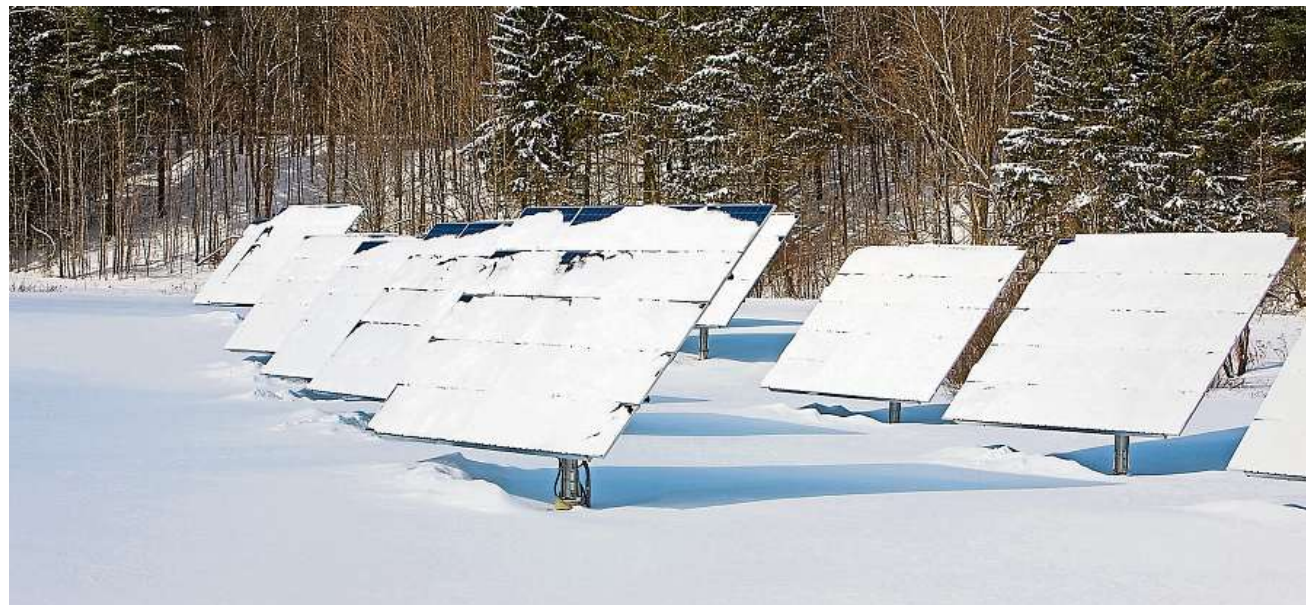
Mehr Stromimporte. Im Winter liefern Solarzellen rund hundertmal weniger, als sie eigentlich leisten könnten.

In der ganzen Schweiz sind Solarpanels für eine Leistung von rund 1700 Megawatt (MW) montiert, was unge-