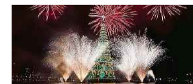
Rio: Grösster schwimmender Weihnachtsbaum der Welt.