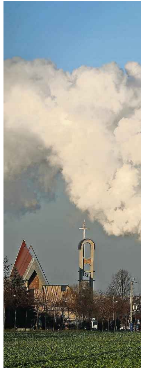
In der Umgebung der polnischen Stadt Kattowitz

Quellen: Europäische Kommission/Bafu/BFS; Grafik: Isi